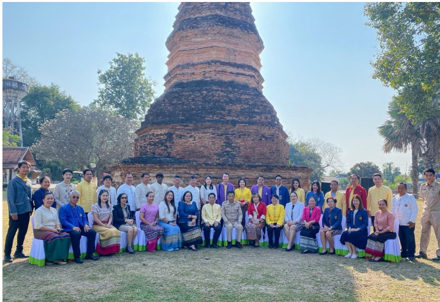
พิธีลงนามบันทึกข้อตกลงความร่วมมือ (MOU) ขับเคลื่อนการใช้แหล่งเรียนรู้เชิงวัฒนธรรม และภูมิปัญญาชุมชนเวียงท่ากาน