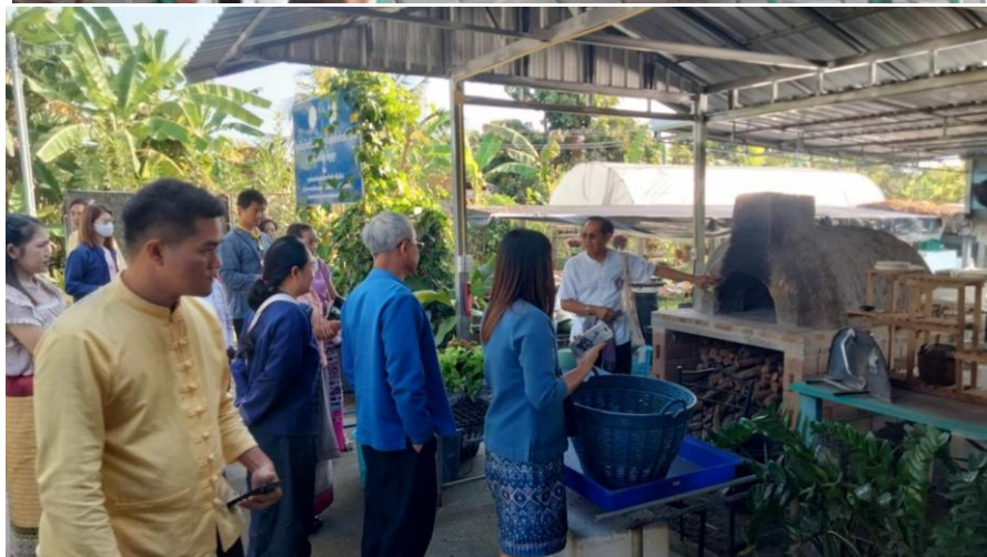
กิจกรรมสาธิตภูมิปัญญา ของชุมชนท่องเที่ยวเวียงท่ากาน